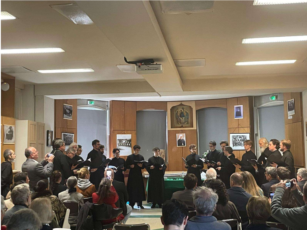
Chœur monastique de Saint-Serge