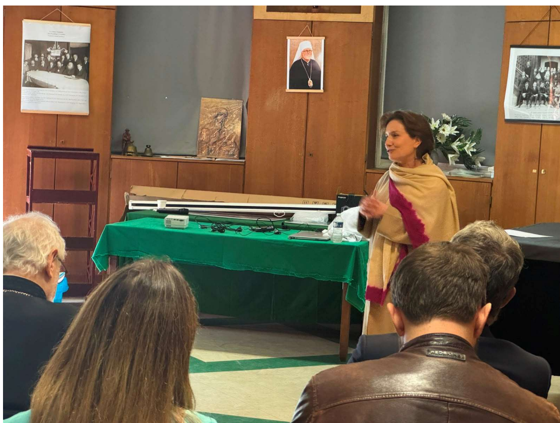
Intervention de Mme Chave