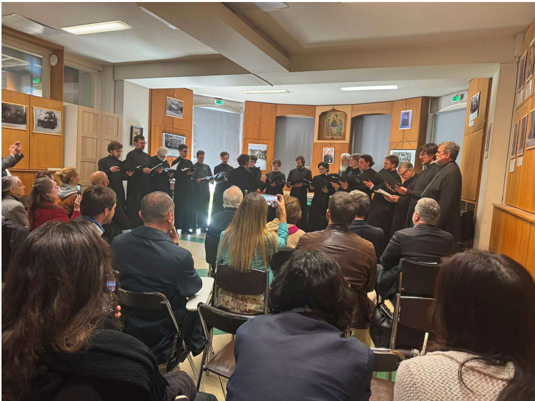
Chœur monastique de Saint-Serge