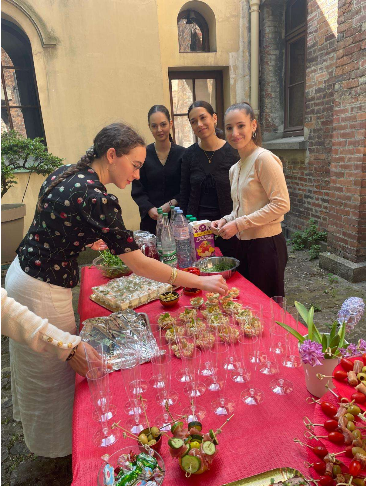
Une autre table du cocktail