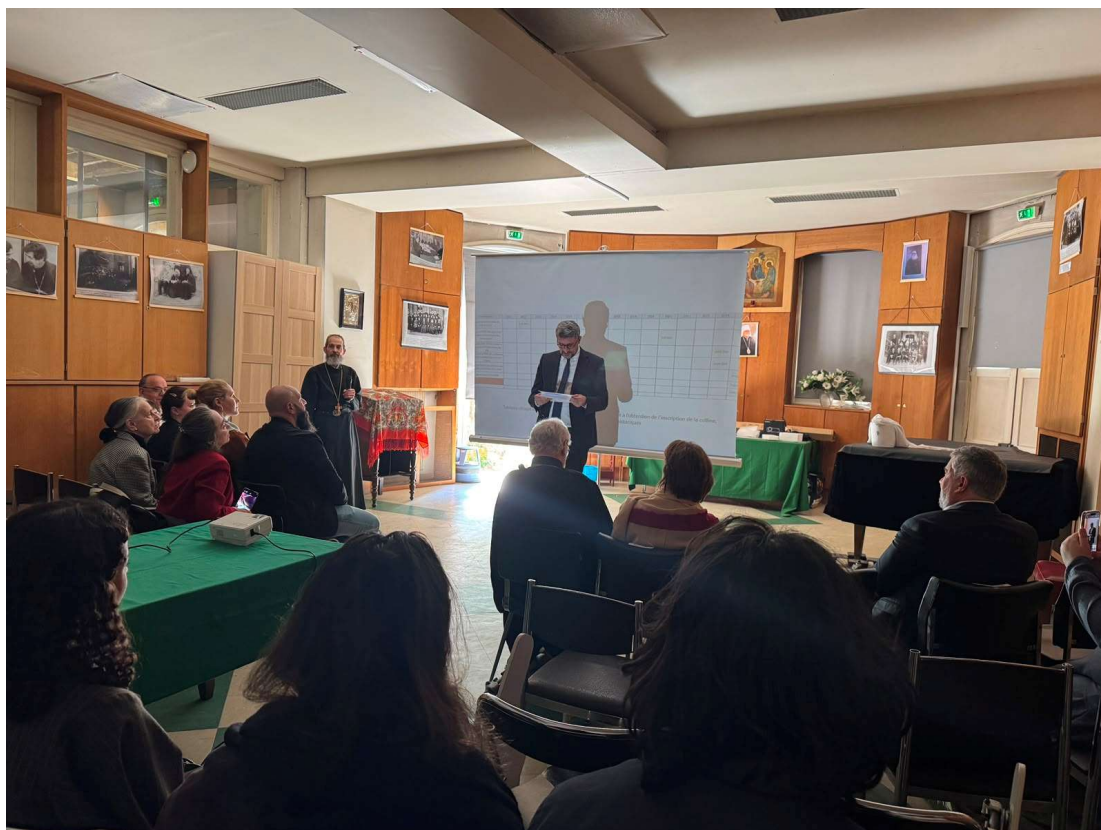
Intervention de Monsieur de Lumley