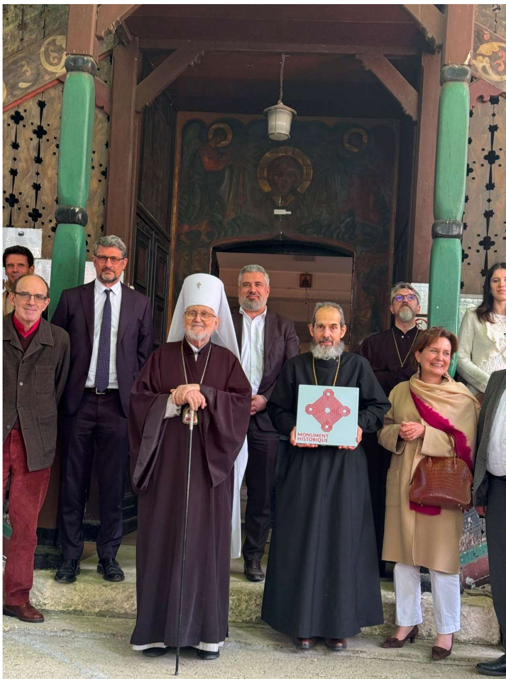
De plus près

Cet événement s'est terminé par un cocktail riche et varié, organisé dans le jardin, à côté du bâtiment de l'église, sous un beau soleil et des températures presque estivales.