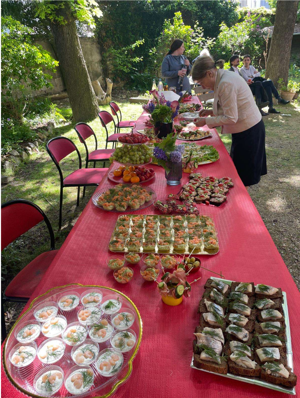
Une des tables du cocktail